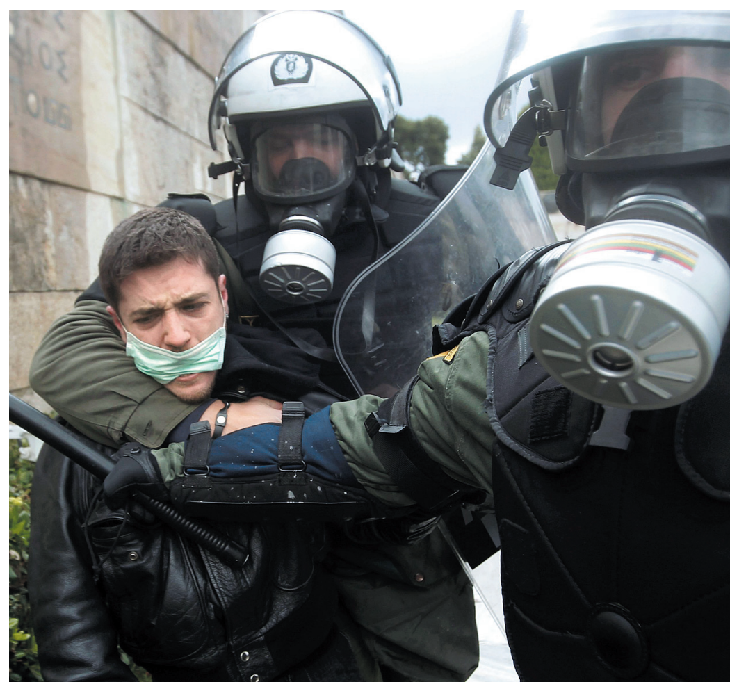
Grécko včera ochromil generálny štrajk kvôli škrtom na záchranu Atén v eurozóne.