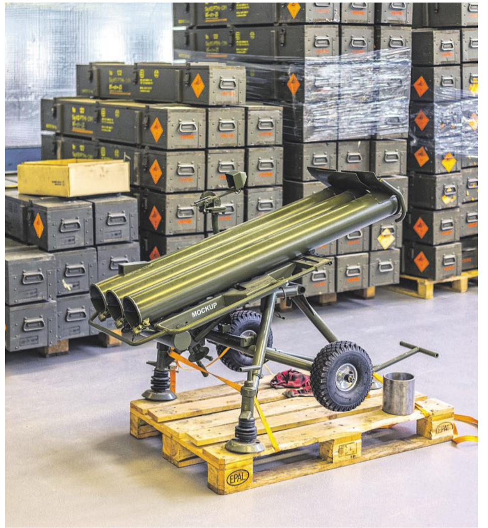
České zbrojovky hlásí rekordní výsledky. Vzrostl zájem o produkty obranného průmyslu, přestože nesměřují přímo na Ukrajinu.