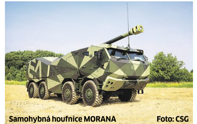
Samohybná houfnice MORANA