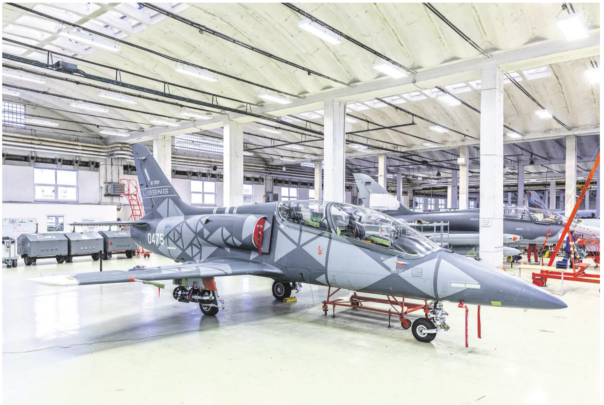
První letouny Aero L-39NG do Vietnamu. Aero Vodochody má za sebou úspěšné období. Prvních šest proudových letounů Aero L-39NG předalo vietnamským vzdušným silám. Zájem o tato letadla nebo o výcvik je ale i v Evropě. Kromě jiného má být výhodou, že platforma umožňuje západní i východní konfiguraci.

~ Válka na Ukrajině ovlivnila naše fungování hlavně tím, že se změnilo vnímání bezpečnosti nejen v Evropě, ale i v dalších teritoriích.