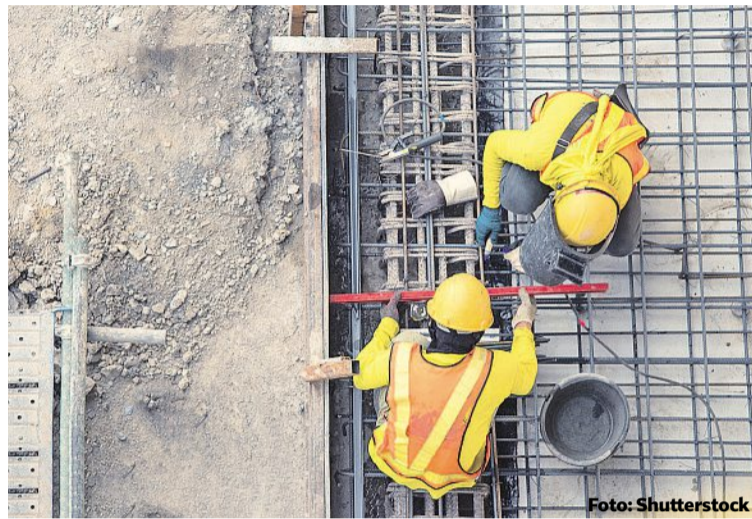
Důvěřuj, ale prověřuj. Aby Skupina ČEZ dodržela evropskou směrnici CSDDD, znamená to pro ni přezkoumání desítek tisíc jejich dodavatelů a subdodavatelů.

Jedním ze zásadních prvků pro vybudování udržitelného dodavatelského řetězce bude bezpochyby transparentnost. Je jasné, že všichni účastníci tohoto řetězce budou muset sdílet data a mít vzájemný přístup k informacím o zdrojích a procesech ve své podnikatelské činnosti.