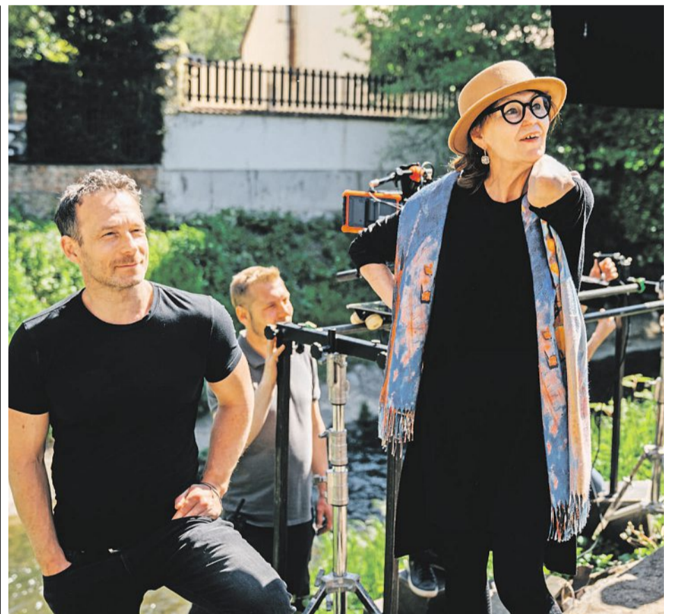
Natáčení filmu nepřináší jen fiktivní příběh. Nese v sobě i poselství, které chce scenárista otevřít jako společenské téma.

Je toho mnoho, chystají se regionální představení a další projekty. Je to energie, která mě hrozně baví, to nejhezčí z věcí v rámci celého projektu. Nedávno jsem byl v České Lípě, kde je velké kino, a po představení si se mnou lidé ještě hodinu povídali a objímali jsme se. Beru to jako největší odměnu, když lidé příběh pochopí a něco s nimi udělá. Když si čtu některé recenze, říkám si, že každý člověk má srdce usazené v těle na jiném místě. Někteří to nepochopí, vnímají svět zvířat úplně jinak. Ale to nerozhoduje o tom, jestli je věc dobrá, nebo špatná. Já obecně nemám rád kritiky. Nenapadlo by mě psát ji ani na věc, která se mi vyloženě nelíbí. Za každým projektem vidím velký sen člověka, který udělal spoustu práce, aby si ho splnil. Nenapadlo by mě ten jeho sen kazit. Napsal jsem příběh o lásce se zvířetem. Pro někoho je ta láska možná hloupá a naivní, ale já ji takhle prožívám.