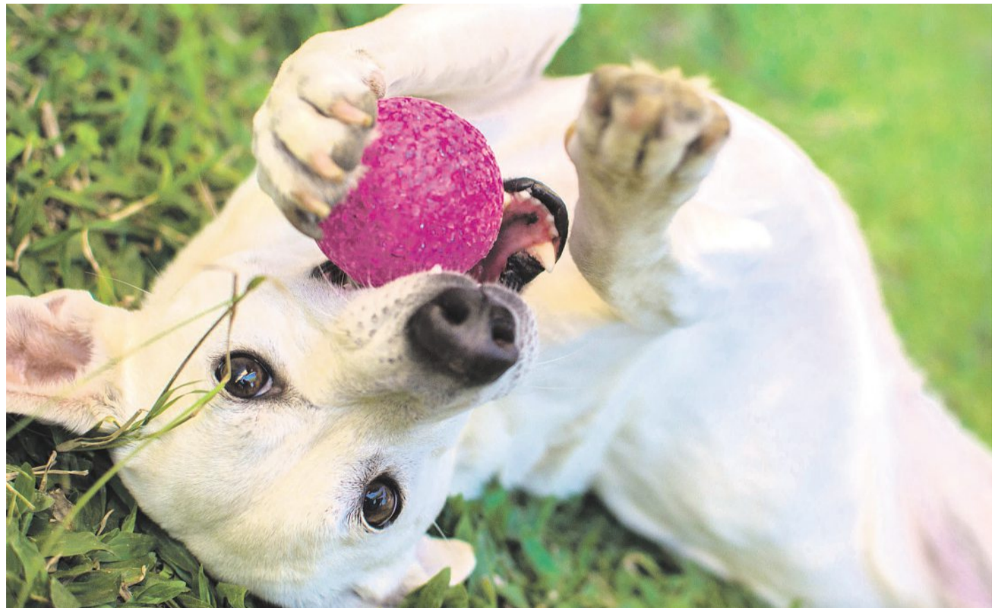
Pes je pes. Proto musí v každodenní rutině chápat, že se chovatel neřídí podle něj. Pojí se s tím i žebrání u stolu, spaní v posteli nebo tahání za vodítko.

Podle Dalibora Špoka stojí za blízkou vzbou člověka a psa více důvodů. Jedním z nich je například to, že česká společnost se silně urbanizovala a potřeba mít psa tady prostě je. „Druhý, který je pro mě daleko zásadnější, je ten, že česká společnost je výjimečná v tom, že složitěji buduje komunity. Rodinné a celoživotní vztahy samozřejmě máme, ale horší je to s těmi, které přicházejí v průběhu dospělosti. Myslím, že na vině jsou totalitní režimy, které zde působily více než v ostatních zemích