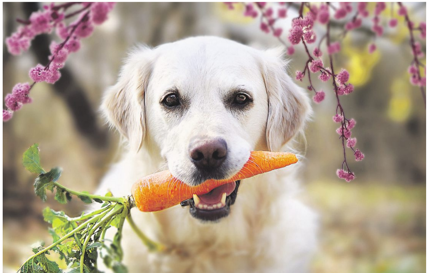
Trendy v krmivech jsou různé, usítě na míru odlišnému typu zákazníků. Jedním z nich je třeba holistické krmivo, které je komplexní a neobsahuje obiloviny.

„Velké značky dělají to, že chrlí na trh stále nové a nové inovace. Jednak tím oslovují segment zákazníků, který chce pořád zkoušet novinky. U konzervativních zákazníků pak očekávají, že se možná nový produkt uchytí, ale třeba také ne. Protože se však naprostá většina produktů dříve nebo později stane ‚psý‘, jak se říká v matici BCG (označuje profilový model strategie, který vyvinula americká společnost Boston Consulting Group. Psi v něm mají nízký podíl na trhu i nízké tempo růstu. – pozn. red.),