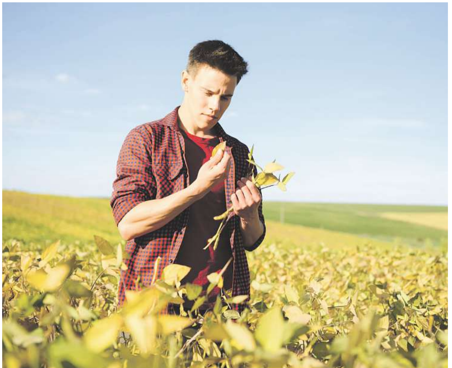
Mimořádně důležité dotace. Podle organizace Copa-Cogeca by se měly země EU snažit do mladých zemědělců investovat co nejvíce. Dotace by se podle ní měly dávat nejen na budování nových stájí či výběhů, ale i na nákup zemědělské půdy.

~ Pokud nebudeme mít mladé farmáře, nemusíme mít ani potravinovou bezpečnost.