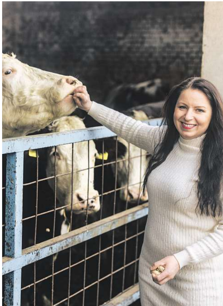
Každý den otevřeno. Na Zlaté farmě ve Štětovicích si mohou návštěvníci kdykoli projít areál, prohlédnout si zvířata a zažít každodenní provoz zemědělského podniku.

Strach máme. Řešili jsme to dlouhodobě a jsme na nejvyšších pojistkách, které můžeme mít.